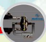
Quadrant MISS System