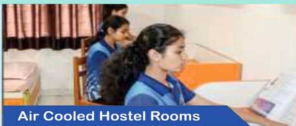
Air Cooled Hostel Rooms