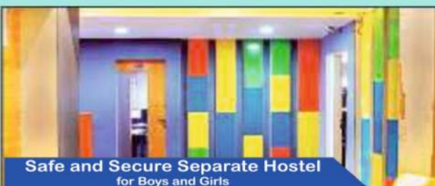
Safe and Secure Separate Hostel for Boys and Girls