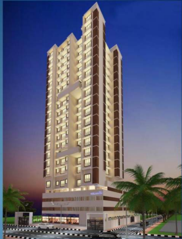
Witty Neelkanth Malad (W)