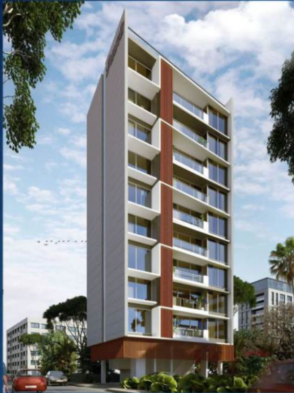
Witty Juhu Vistas Vile Parle (W)