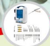
MIDAS REX Advanced Drill System