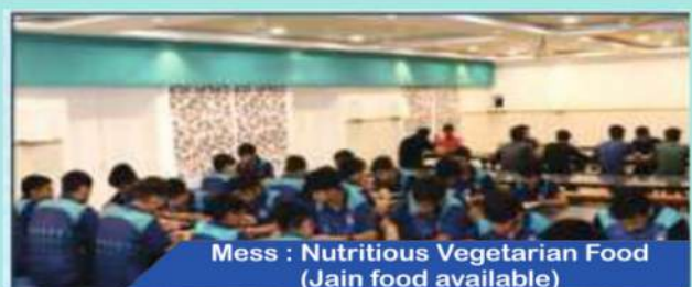
Mess : Nutritious Vegetarian Food (Jain food available)