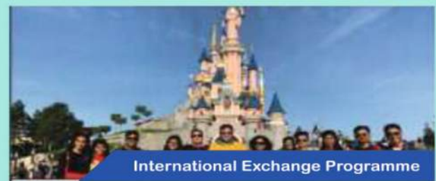
International Exchange Programme

New Bhupalpura, Udaipur Ph. :7023002979, 9929016715